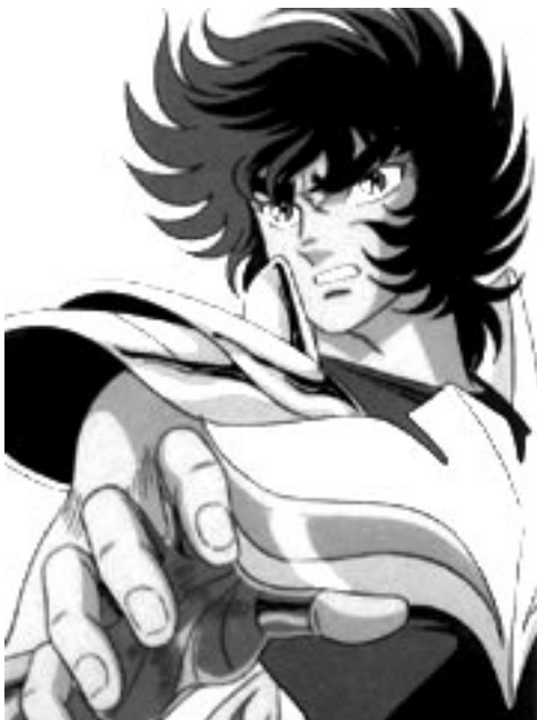
Ikki , dans Saint Seiya .