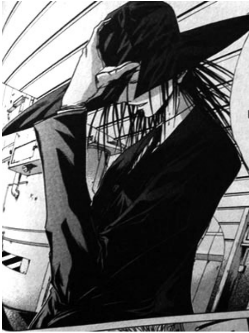
D' Jackal , dans Get Backers .