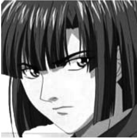
Akira , dans Hikaru no Go .