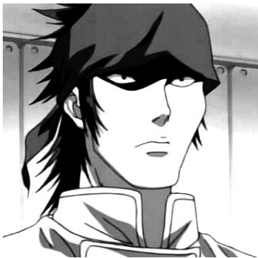
Suwabara , dans Yakitate!! Japan .