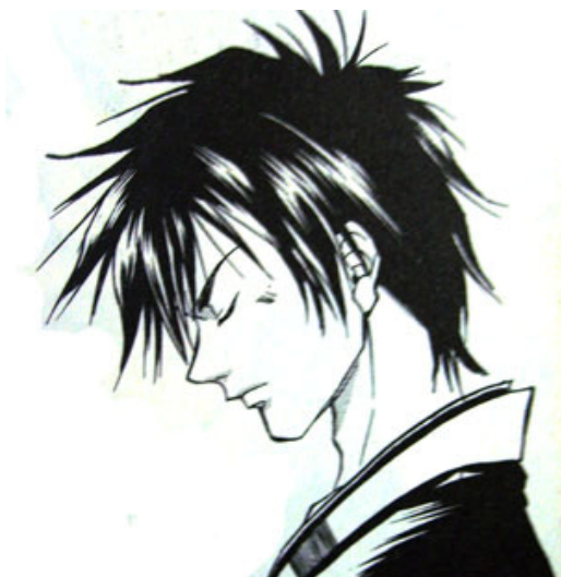
Kyo , dans Samurai Deeper Kyo .