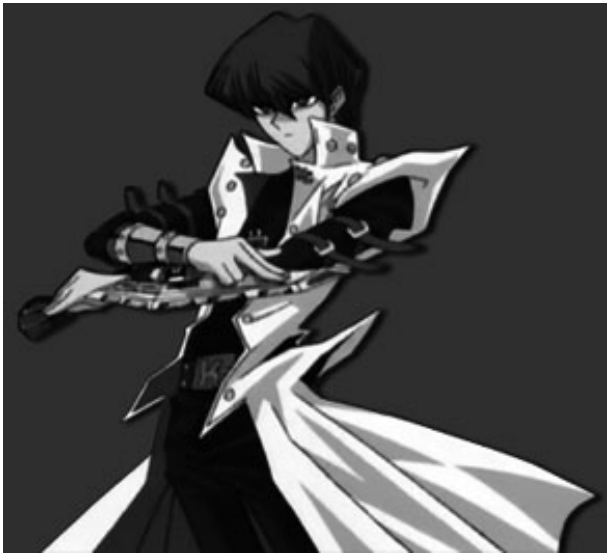
Kaiba , dans Yu-Gi-Oh! .