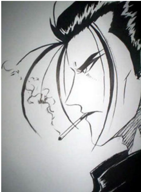
Saito , dans Kenshin le Vagabond .