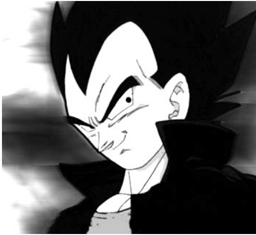
Végéta , dans Dragon Ball .