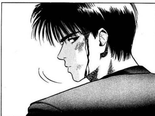
Rukawa , dans Slam Dunk .