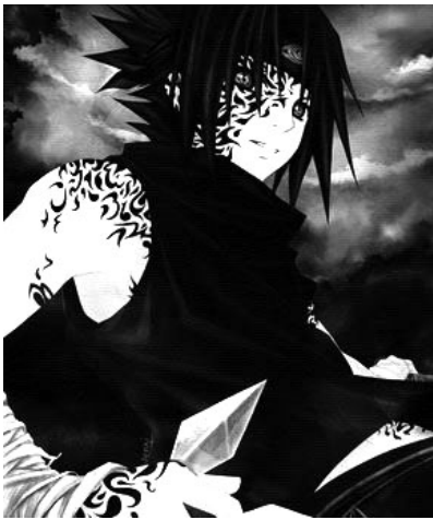
Sasuke , dans Naruto .