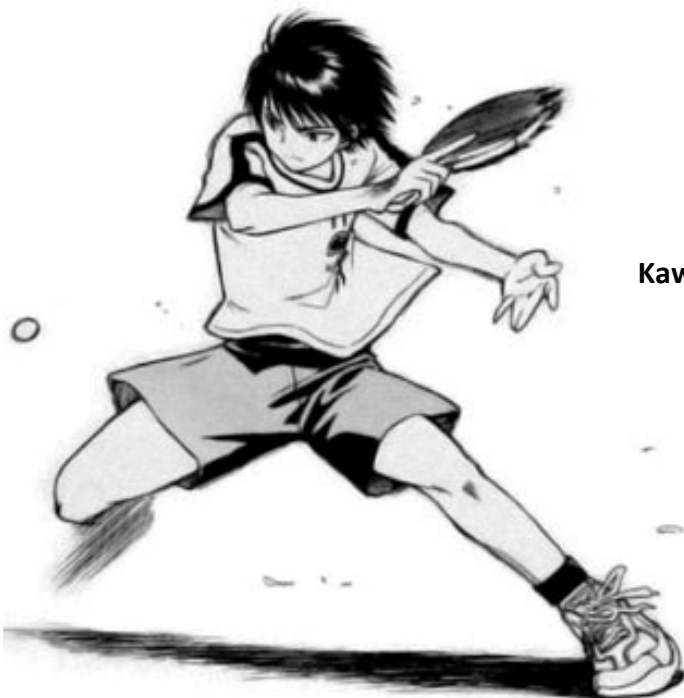
Kawazue , dans P2 .