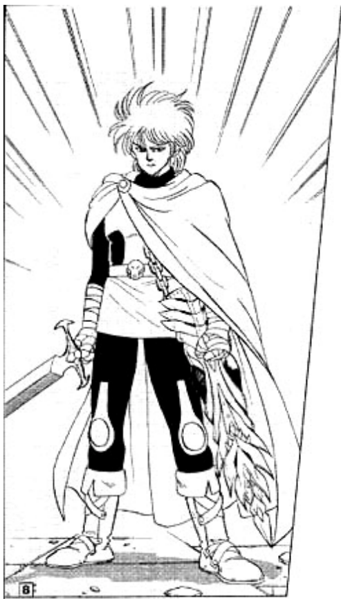
Hyunkel , dans Fly .