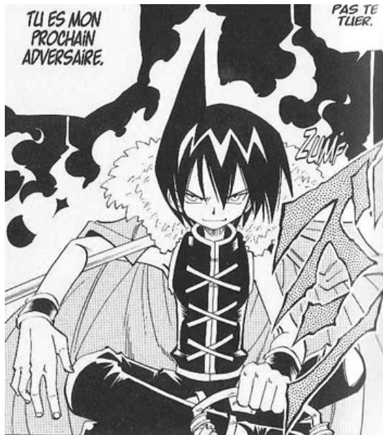
Tao Ren , dans Shaman King .